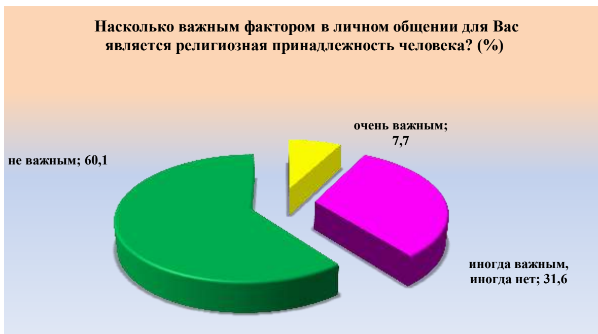
Рис. 4. Оценка респондентами религиозной принадлежности человека как фактора общения Fig. 4. Respondents' assessment of a person's religious affiliation as a factor of communication

Не испытывают неприязнь к представителям каких-либо национальностей, проживающих в регионе, 73,2 % респондентов. 26 % ответили, что испытывают неприязнь. Следовательно, уровень толерантности населения довольно высокий.