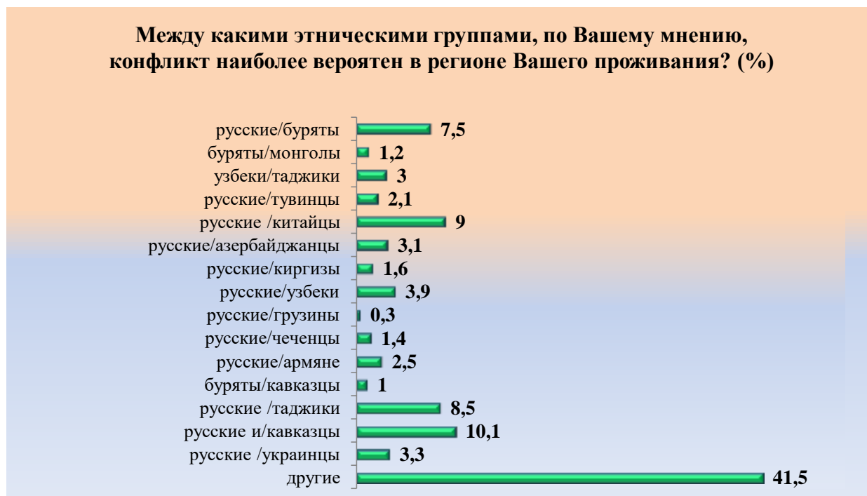
Рис. 6. Наиболее вероятные, по мнению респондентов, варианты конфликтов Fig.6. In the respondents' opinion, the most likely, variants of conflicts

Ответы на вопрос о способах разрешения межнациональных конфликтов показали, что многие считают, что этим должны заниматься представители государственной власти. Вариант ответа «пусть этим занимается государство» выбрали 53,3 % опрошенных. Считают, что «люди должны сами искать пути межнационального согласия» – 39,2 %. 23 % респондентов считают важным проводить больше совместных праздников и других мероприятий. Опрошенным было предложено назвать и свои варианты ответа. Респонденты считают, что мигрантов нужно воспитывать, приучать соблюдать нормы (0,9 %). 0,7 % опрошенных считают важным регулирование в сфере трудовых отношений. Радикально настроены 3 % респондентов, они ответили, что мигрантов нужно выгнать.