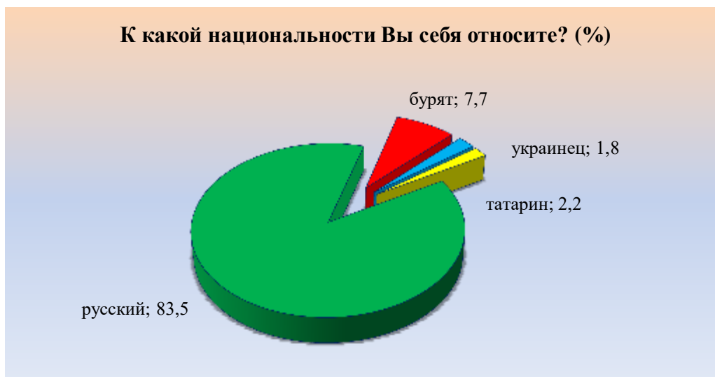
Рис. 1. Национальная идентичность опрошенных респондентов Fig.1. Respondents' national identity