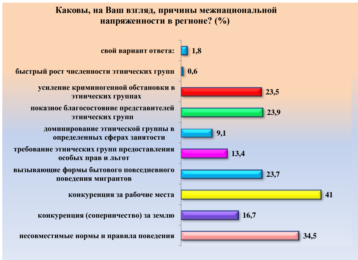
Рис. 5. Причины межнациональной напряженности Fig. 5. Reasons for interethnic tension

Вопрос «Между какими этническими группами, по Вашему мнению, конфликт наиболее вероятен в регионе Вашего проживания?» был открытым и опрошенные предложили довольно большое их количество. Наиболее вероятны, по мнению опрошенных, между: русскими и «кавказцами» (10,1 %), русскими и китайцами (9 %), русскими и таджиками (8,5 %), русскими и бурятами (7,5 %), русскими и узбеками (3,9 %).