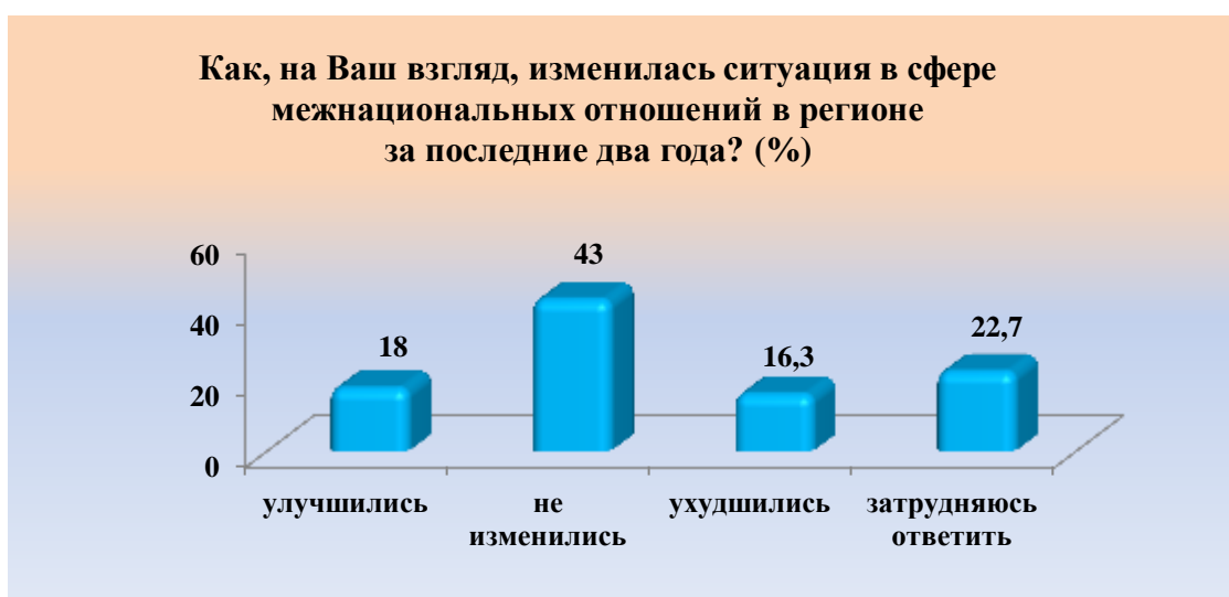
Рис. 2. Оценка респондентами ситуации в сфере межнациональных отношений в регионе за последние два года Fig. 2. Respondents' assessment of interethnic relations in the region over the past two years

Опрошенным жителям Иркутской области было предложено выбрать те источники, из которых они, в первую очередь, получают информацию по проблемам, связанным с межнациональными и межконфессиональными отношениями. Главными по этому вопросу респонденты считают: Интернет (61,3 %), передачи центрального телевидения (48 %), общение с родственниками, соседями, знакомыми (31 %), передачи областного, местного телевидения (26,8 %). Менее важную роль играют центральные газеты (10 %) и районные (8,6 %). Только 2,8 % опрошенных ответили, что получают такую информацию на встречах с представителями