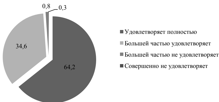
Рис. 1. Оценка степени удовлетворенности родителей качеством образования в детском саду, %