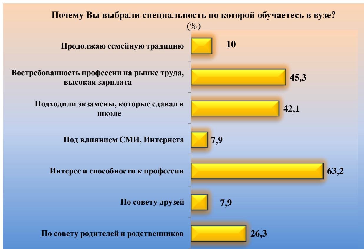
Рис. 2. Причины выбора специальности респондентами, (%)

Более подробно мы остановились в своем исследовании на вопросе профессионального интереса, что дает возможность более глубоко изучить проблему мотивации уже на этапе профессионального становления будущего специалиста (Мосиенко, 2017). Респондентам был задан вопрос о причинах интереса к их профессиональной деятельности (рис. 3). Наибольшее значение для опрошенных имеет фактор «возможность видеть результаты своего труда» (40,5 %). Этот вариант ответа свидетельствует о необходимости удовлетворения у молодых людей потребности быть сопричастными к деятельности и ее результатам, удовлетворения чувства быть нужным. Видимые результаты работы повышают профессиональную мотивацию и интерес.