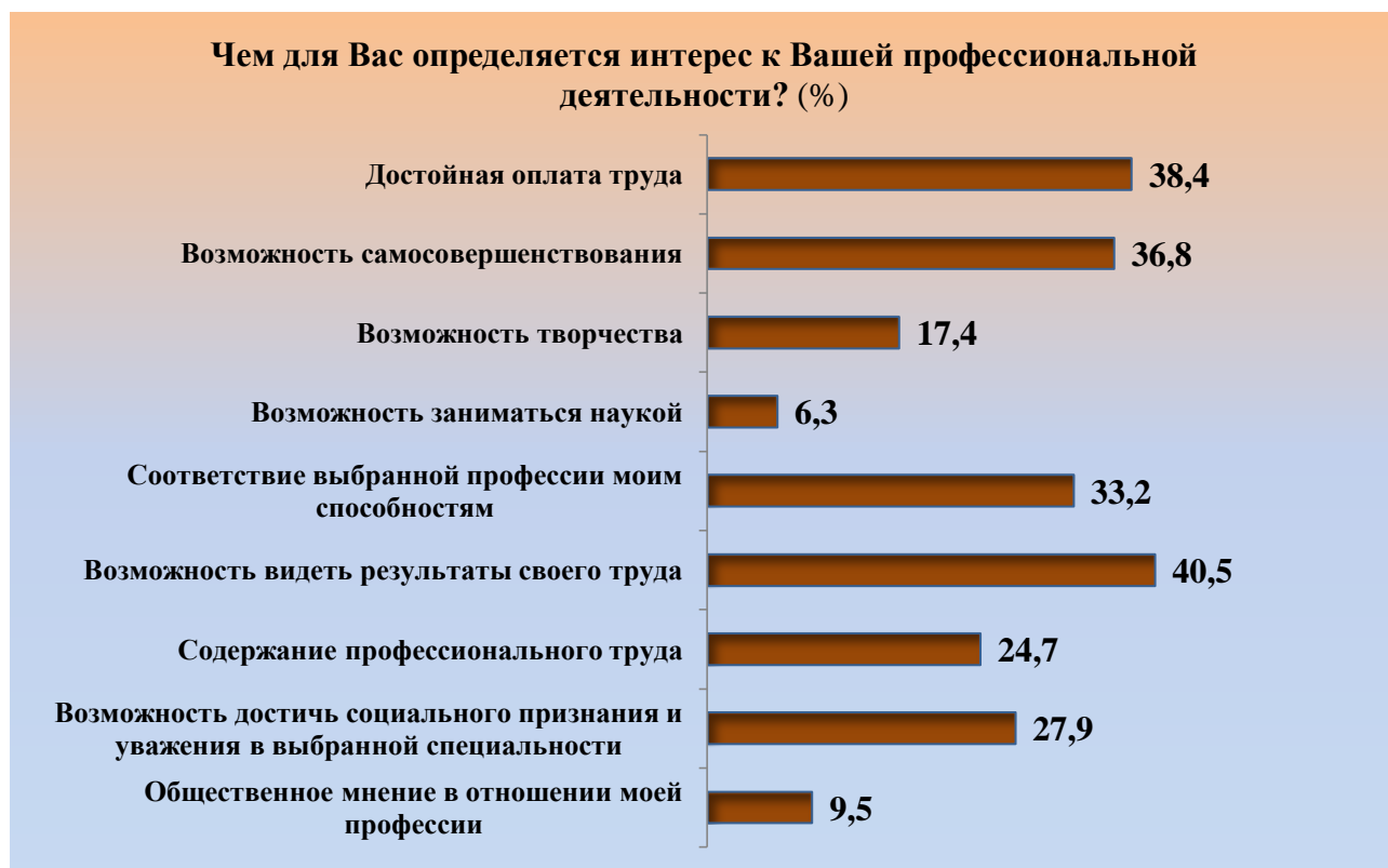
Рис. 3. Факторы интереса студентов к профессиональной деятельности, (%) Fig. 3. Factors of students' interest in professional activity, (%)

Второй по значимости фактор, который отметили обучающиеся, – это достойная оплата труда (38,4 %). Этот результат коррелирует с данными по предыдущему вопросу. Значимость фактора оплаты труда не стоит игнорировать, он также важен для студентов регионального вуза, как и классическая профессиональная мотивация, связанная с интересом к специальности. Третий важный фактор интереса к выбранной специальности «возможность самосовершенствоваться» (36,8 %). Он связан с процессом разворачивания профессиональной траектории по наиболее благоприятному сценарию и подкреплением этого процесса дополнительными свойствами в виде самообразования, самореализации и т. д.