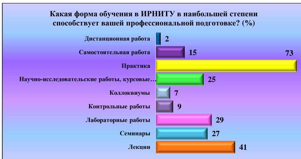
Рис. 2. Оценка эффективности различных форм учебного процесса (не более 3-х вариантов выбора) Fig. 2. Evaluation of effectiveness of various forms of educational process (no more than 3 options)