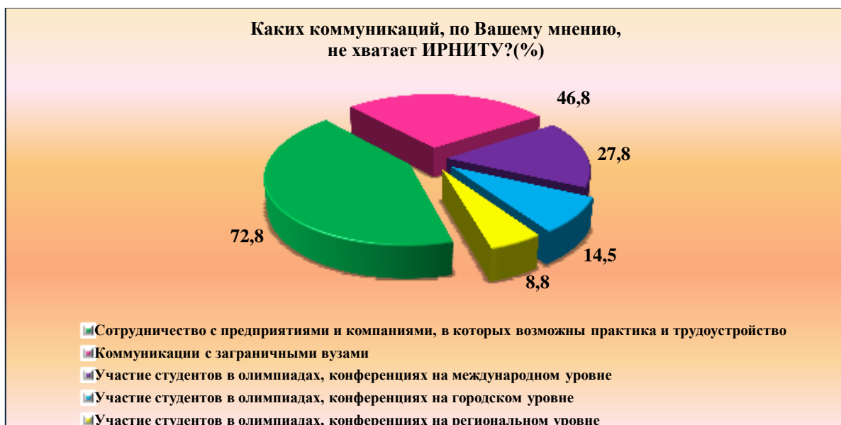
Рис. 6. Недостаточный уровень коммуникаций Fig. 6. Insufficient level of communication

Это тройка личностных качеств, которых не хватает современным студентам для работы в коллективе и которые они бы хотели у себя развивать (рис. 7).