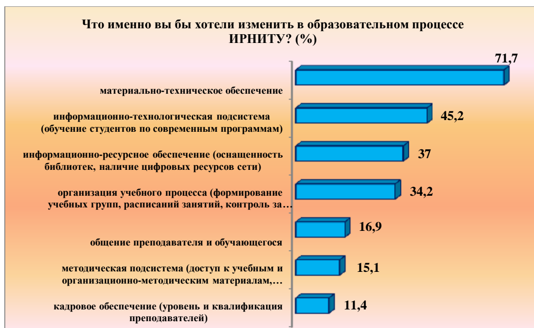
Рис. 1. Оценка необходимости изменений компонентов учебного процесса (не более 3-х вариантов выбора)