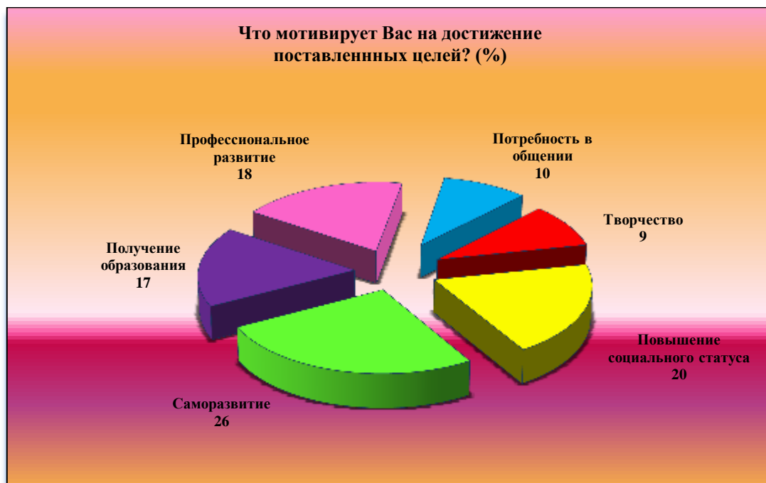
Рис. 4. Источники мотивации студентов ИРНИТУ Fig. 4. Sources of motivation for students of INRTU