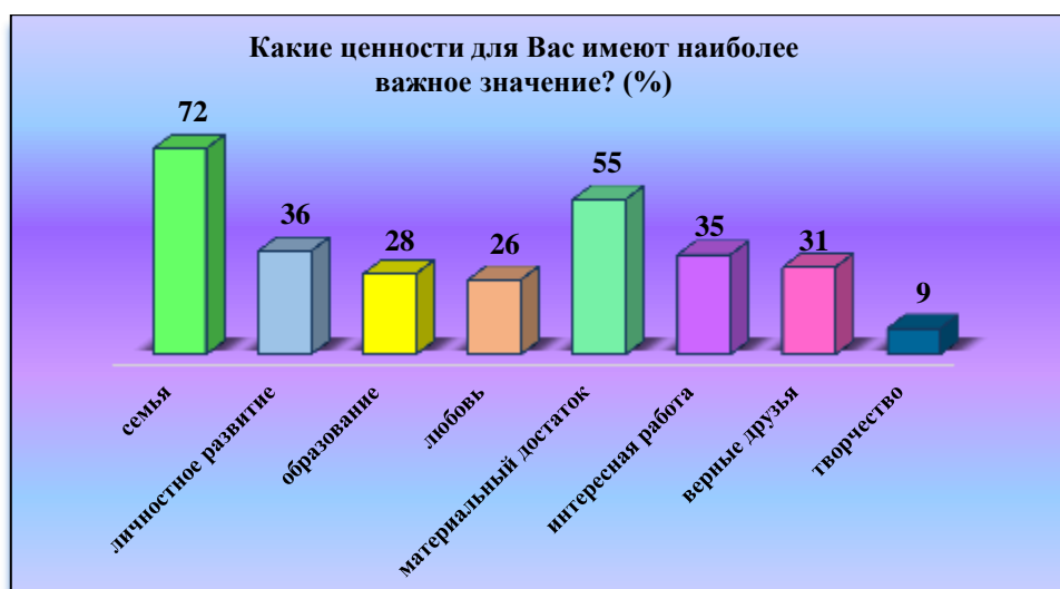
Рис. 3. Ценностные ориентации студентов ИРНИТУ Fig.3. Value orientations of INRTU students

Так, анализируя ценностные характеристики студентов ИРНИТУ можно выделить следующие тенденции. Традиционно, уже на протяжении нескольких лет, на первом месте в системе ценностей студенческой молодежи стоит семья (72 %), на втором материальные показатели (55 %), затем личностное развитие (36 %) и интересная работа (35 %) (рис. 3).