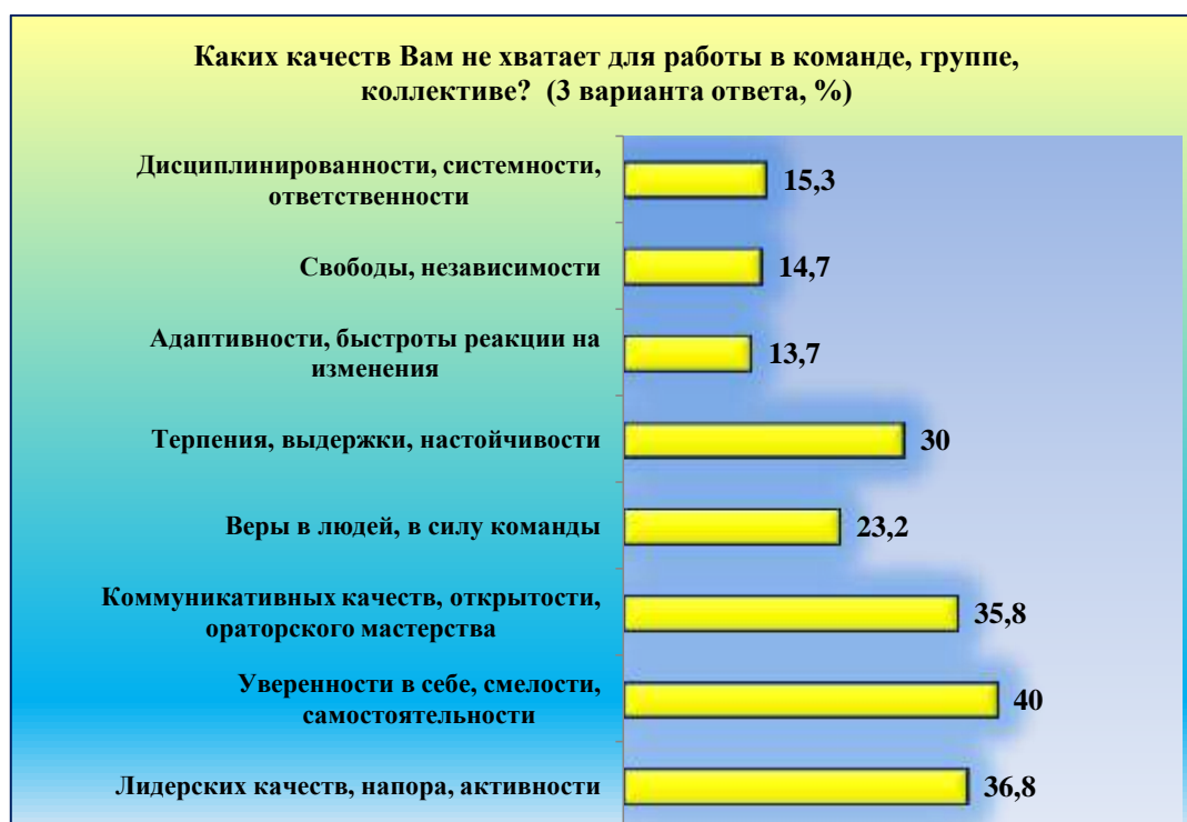
Рис. 7. Личностные качества для работы в команде Fig. 7. Personal qualities for teamwork

(Зайченко, 2017). В связи с этим становится актуальной работа по формированию личностных качеств, навыков коллективной деятельности, которые будут востребованы и в будущей профессиональной сфере студентов, и в процессе межличностного взаимодействия (Гансуар, 2015).